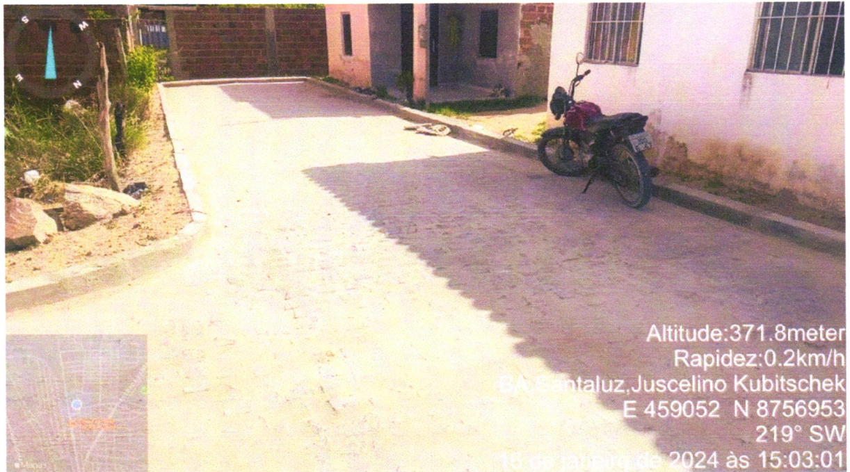
Execução de pavimentação Rua José Aristide Monteiro (Trecho III)